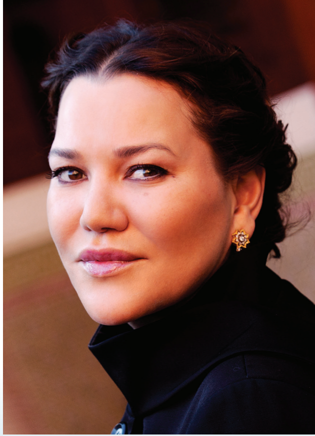
صاحبة السمو الملكي الأميرة الجليلة للا حسناء، رئيسة مؤسسة محمد السادس لحماية البيئة.